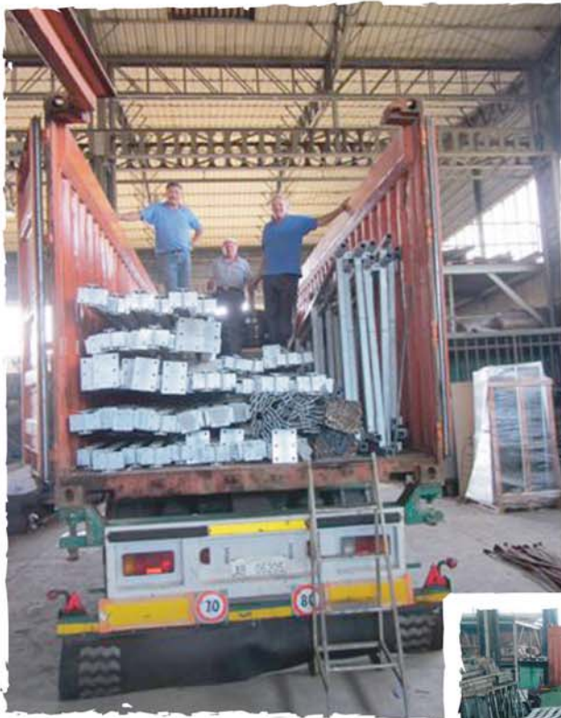
CARICO NEI CONTAINERS DELLE STRUTTURE PORTANTI